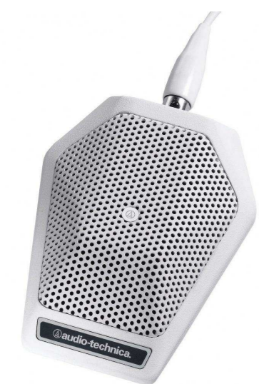
AUDIO-TECHNICA от 3 182 р.