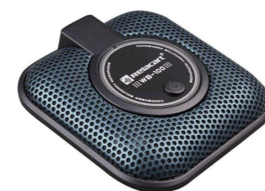
RELACART от 18 149 р.