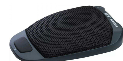
JTS от 10 312 р.