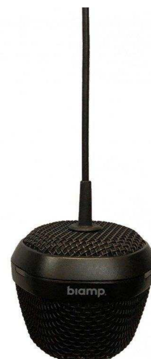
BIAMP от 155 913 р.