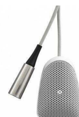
SHURE от 20 700 р.