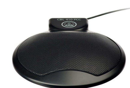
AKG от 12 900 р.

Подберем оборудование точно под задачу по этим характеристикам: