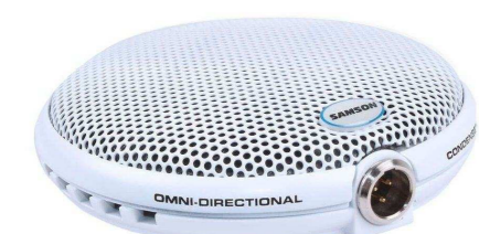
SAMSON от 6 273 р.